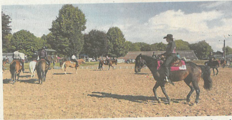
Der RFV Hattorf am Harz, hier das Westernturnier im Jahr 2021, möchte seinen Reitplatz modernisieren.